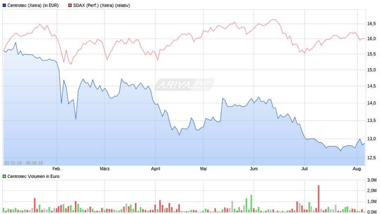
Kursentwicklung und Handelsvolumen CENTROTEC (XETRA) von Jan. bis Anfang August 2018

Die CENTROTEC-Aktie (WKN 540 750 oder ISIN DE0005407506) musste im Verlauf des ersten Halbjahres 2018 deutliche Kursrückgänge verkraften. Anfang Januar wurde mit 15,88 EUR der Jahreshöchstkurs im XETRA-Handel der deutschen Börse erzielt und kurz vor Ende des Halbjahres mit 13,10 EUR der Tiefstkurs innerhalb des ersten Halbjahres 2018 (Vj. zwischen 14,83 und 19,76 EUR). Zum 30.06.2018 schloss die Aktie das Halbjahr mit 13,20 EUR. Ein Jahr zuvor hatte der entsprechende Kurs 19,26 EUR betragen. Nachdem Berichtszeitraum gaben die Kurse weiter leicht nach, stabilisierten sich aber ab Mitte Juli bei Kursen leicht unter 13 EUR. Die Zahl der gehandelten Aktien stieg im ersten Halbjahr gegenüber dem Vorjahreszeitraum zunächst leicht, im Anschluss an das Aktienrückkaufprogramm im Juni dann deutlich an.